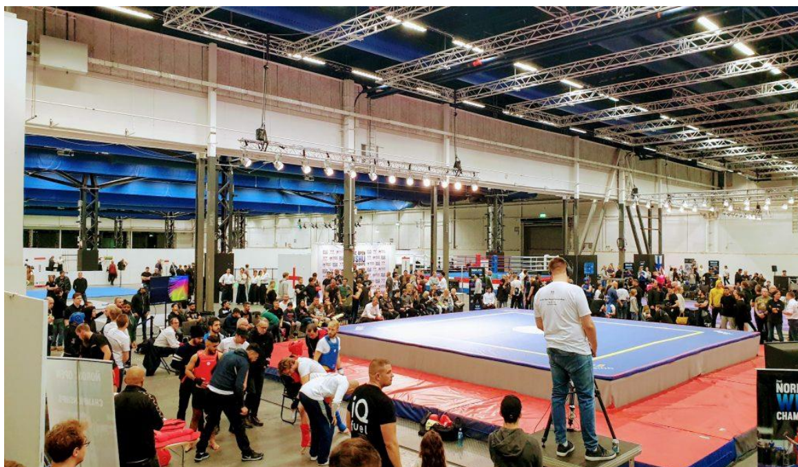
Välbesökt Nordic Open Wushu Championships 2019.

Förbundet har under 2019 fortsatt sin satsning på nationella tävlingar, riksläger och utformning av tävlingsregler – allt för att skapa så bra förutsättningar för idrotten wushu som möjligt.